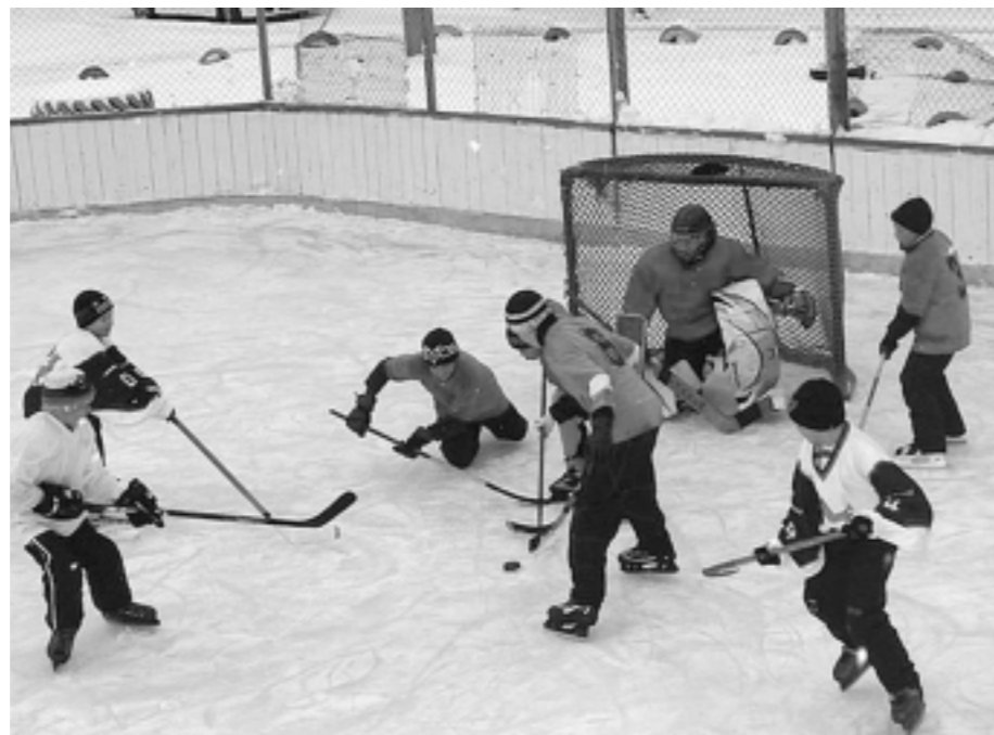
Хоккей - азартная игра